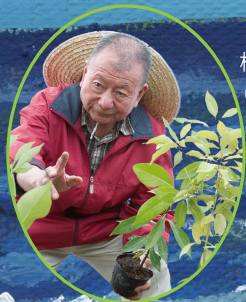
横浜国立大学名誉教授 宮脇 昭先生監修