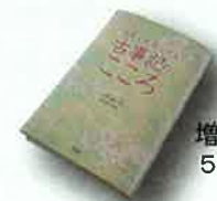
増補改訂版 5月発売予定