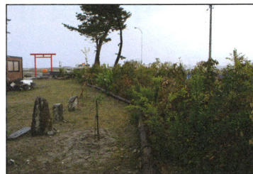
育ち始めた鎮守の森（八重垣神社）