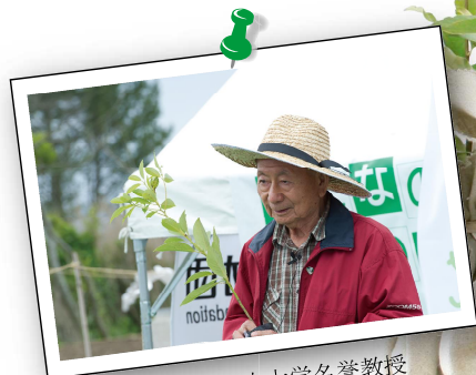
監修：横浜国立大学名誉教授 宮脇昭先生 ※植樹祭当日宮脇先生は 参加されません。