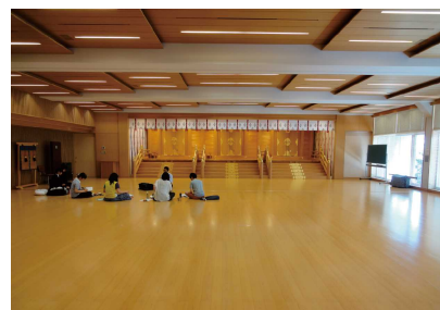
國學院大學祭式教室

備考 動きやすい服装でご参加ください。靴下をご用意ください。女性の方はスカートは不向きです。