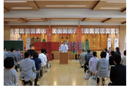
國學院大學祭式教室

備考 動きやすい服装でご参加ください。靴下をご用意ください。女性の方はスカートは不向きです。